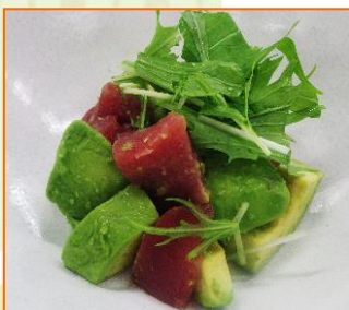
アボガド鮪サラダ