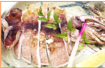
スルメイカ一夜干