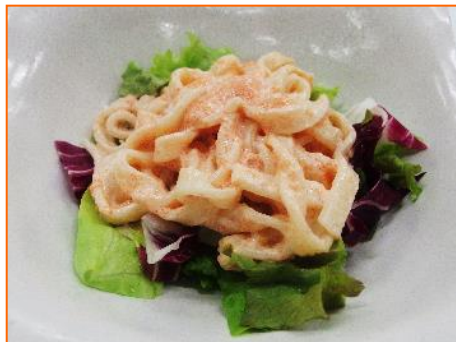
明太きしめんサラダ