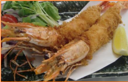
なごや大海老フライ